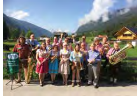
TAUSEND TAKTE MARSCHMUSIK Ensemble des Musikvereins Viktoria o8 Ober-Roden

12.00–14.00 Uhr Europäischer Kochworkshop