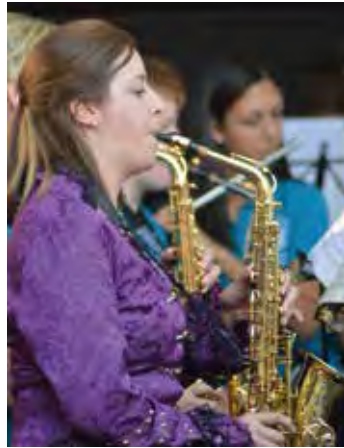
Musikverein Viktoria 08 Ober-Roden