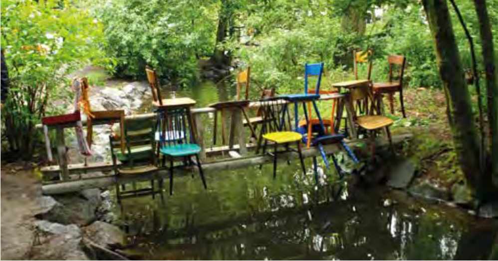
Kunstinstallation zum Brückenfest im Park am Entenweiher