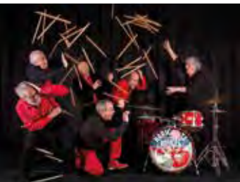
LES HARICOTS ROUGES

Sa. 15.6.2019, 20.00 Uhr Palastzelt im Park