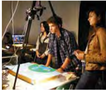
Hang-Szín-Tér Kunstschule, Trickfilm-Erstellung

Zu den beliebten kulturellen Angeboten Bodajks gehören Glühwein-Kochwettbewerb, Tag der ungarischen Kultur, der Pogatsche- und Wein-Wettbewerb, die Nacht der Tempel und der 20. August. Die größte Veranstaltung Bodajks sind die dreitägigen Stadt-Tage, an denen die Besucher Ausstellungen, Konzerte, kulturelle und gastronomische Programme erwarten.