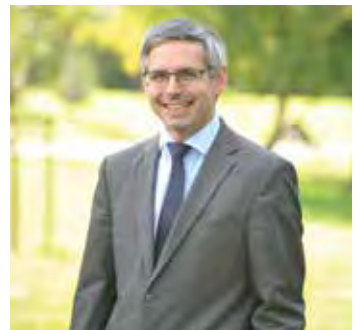
Vincent Chriqui Bürgermeister von Bourgoin-Jallieu

„Ich bedanke mich bei den Organisatoren für ihr Engagement und wünsche dem Kulturfestival viel Erfolg. Möge es dazu beitragen die Freundschaften, die Kultur und den nun schon für längere Zeit andauernden Frieden in Europa zu stärken.“