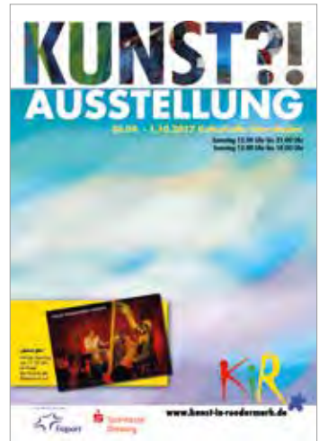
KiR-Kunstausstellung 2017 mit dem Thema „Flügelwesen“

Im Rahmen des Festivals „Kultur ohne Grenzen“ findet auch die KiR-Kunstausstellung mit Vergabe des KiR-Kunstpreises statt. Das Thema der Ausstellung ist dieses Jahr „Zukunft!Europa?“. Bei der Umsetzung des Themas sind der Phantasie keine Grenzen gesetzt. Die Anmeldung ist bis 15.3. möglich. Weitere Informationen: www.kunst-in-roedermark.de und ausstellung@kunst-in-roedermark.de .