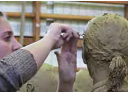
Hang-Szín-Tér Kunstschule, Bildhauerwerkstatt

Seit 12 Jahren wird in der Hang-Szín-Tér Mittelschule in den Bereichen Musik, Tanz und Bildende Kunst unterrichtet.