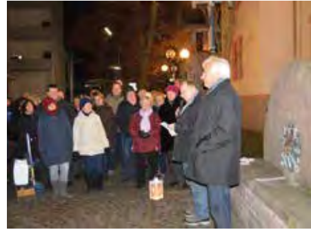
IGOR Laternen Rundgang

So. 16.6.2019, 10.00 Uhr Treffpunkt Häfnerplatz