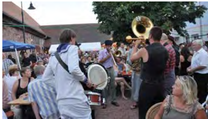
„Häfner Open“ vor der Kelterscheune in Urberach