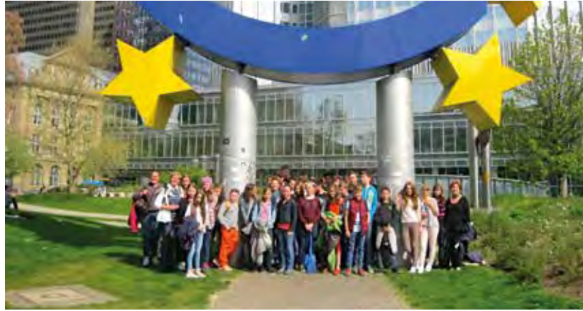
Französische Austauschschüler aus Bourgoin-Jallieu mit Schülern der NBS in Frankfurt

Die Kultur in der Stadt nimmt eine besondere Bedeutung im Selbstverständnis der Bürgerinnen und Bürger von Bourgoin-Jallieu, den Berjalliens, ein. Das Jean-Vilar-Theater, das auf Initiative des Malers Victor Charreton gegründete Museum, die Mediathek, das Konservatorium Hector Berlioz, die aktuelle Musikszene Les Abattoirs sowie das jährliche Kunstfestival im Parc des Lilattes zeigen exemplarisch die Vielfalt des kulturellen Lebens.