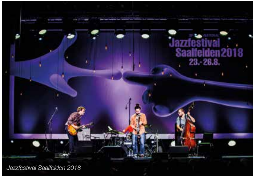
Jazzfestival Saalfelden 2018

Lebensqualität in unserer Stadt beiträgt. Unsere kulturelle Visitenkarte ist das Internationale Jazzfestival Saalfelden, das jedes Jahr in der letzten Augustwoche Musikfans aus der ganzen Welt begeistert. Mit dem Kunsthaus Nexus, dem Bildungszentrum und dem Museum Schloss Ritzen haben wir drei weitere große „Kulturplayer“. Auch die Tourismuswirtschaft hat Kultur und Tradition fest im Markenkonzept der Region verankert. Die Musikkapellen, das Musikum, die Brauchtumsvereine und viele andere Kulturinitiativen und Künstler tragen dazu bei, dass der kulturelle Tisch in Saalfelden immer reich gedeckt ist.