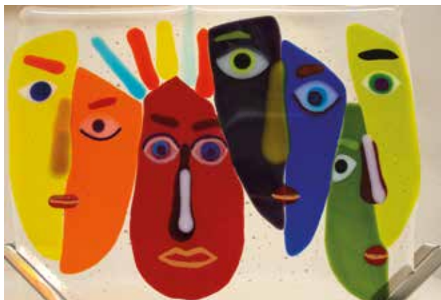
Die Mischung macht's

Bereits im Vorfeld des Kulturfestivals gab es Arbeitstreffen in den Partnerstädten Saalfelden, Tramin und Bodajk zur Abstimmung gemeinsamer Aktivitäten. In einer Freundschaftsskulptur wird die europäische Begegnung über das Kulturfestival hinaus in Rödermark nachhaltig präsent und für die BürgerInnen und