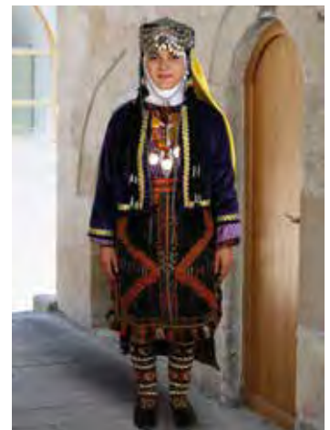
Junge Frau mit Volkstracht aus dem Dorf Basak

abend in Wasser eingeweicht; am nächsten Morgen wird dann die Suppe gekocht. Man kann die Fladen auch im getrockneten Zustand essen, wenn man kräftige und gesunde Zähne hat.