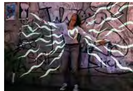
BANDART spielen herausragende Live-Animations- und Tanztheateraufführungen im Innen- und Außenbereich. Ihre Shows erhielten 3 Auszeichnungen und wurden zu mehr als 90 internationalen Festivals auf 4 Kontinenten eingeladen.