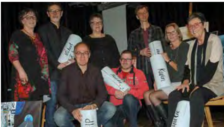
Ehrung der tragenden Säulen von KiR zum 10. Geburtstag