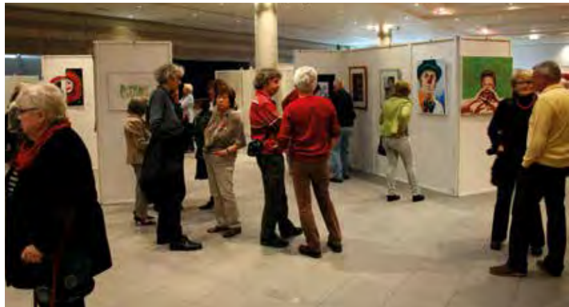
Ausstellung Gedankenwelten im Foyer der Kulturhalle