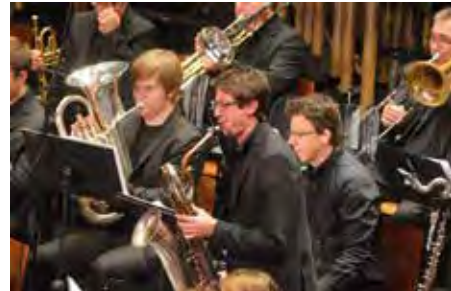
Musikverein 03 Ober-Roden