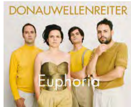
DONAUWELLENREITER „Nicht Rock, nicht Folk, nicht Jazz. Sondern Musik einer neuen Welle.“ (FOLKER, Musikzeitschrift)