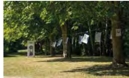
„grenzenlos grün“ im Park am Entenweiher