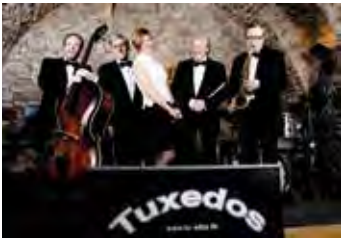
THE SWINGING TUXEDOS

Fr. 8.3.2019, 20.15 Uhr Kulturhalle Rödermark