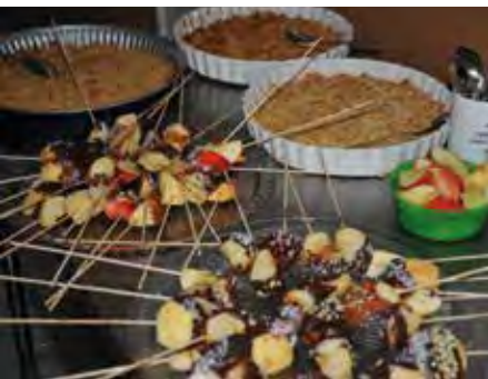
Vom Festival-Kochteam zubereitet