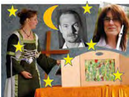
Seien Sie herzlich willkommen zur „Langen Nacht der Europäischen Märchen“.

Liebevoll vorgetragen, fesseln Sie Märchenerzähler aus den Partnerstädten und die lokalen Märchenerzähler sowie die Puppenspieler