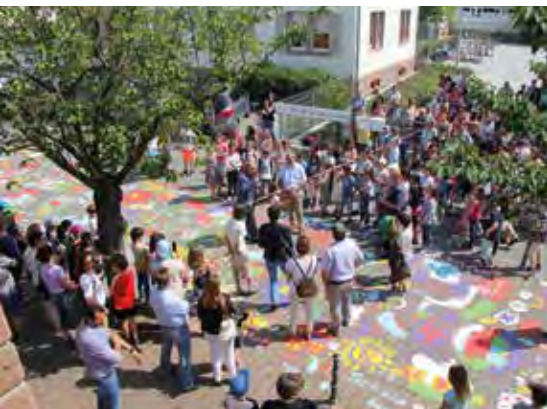
Straßenbemalung vor der Schule an den Linden