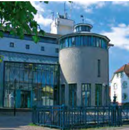
Bücherturm mit Rothahausaal