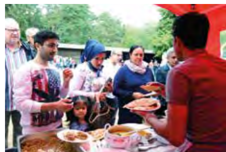
Netzwerk für Flüchtlinge Rödermark

Oswald-von-Nell-Breuning-Schule und Rödermärker Vereinen.