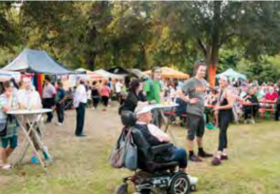
„grenzenlos grün“ war Impulsgeber für unser Kulturfestival

Musik europäischer Bands, Tanz, Theater, Geschichten und der Austausch kulinarischer Genüsse werden frei nach dem international erfolgreichen Geiger und