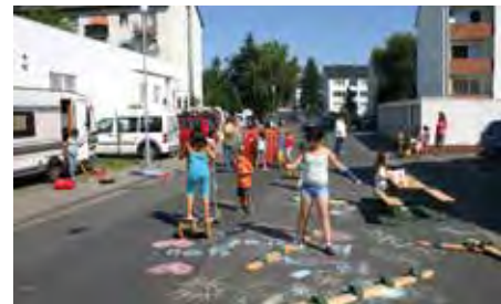
Straßenaktion vor dem SchillerHaus