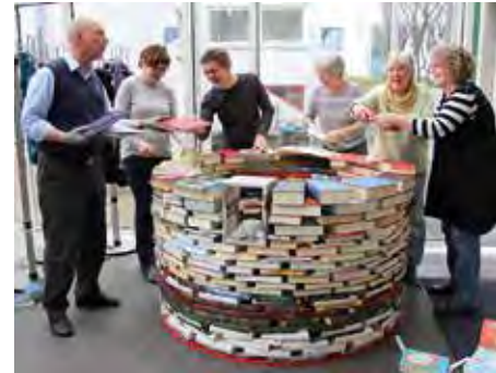
Freundeskreis beim Bau des Bücherturms im Bücherturm

Weitere Termine am 22.6., 7.7., 11.8. und 18.8.