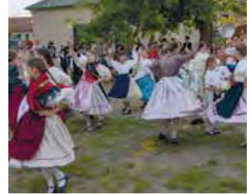
Der Tanzverein 3FALU Táncműhely