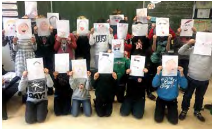
Theatergruppe der Schule an den Linden

Samstag, 9.3.2019 20.00 Uhr im Graf-Reinhard-Saal