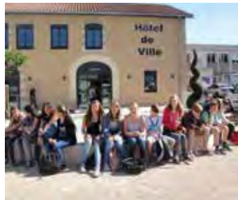
Austauschschüler der NBS in Bourgoin-Jallieu vor dem Rathaus