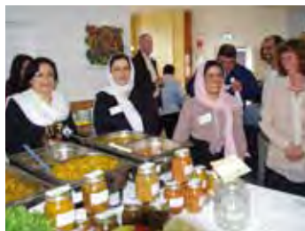
Verein Alle für Alle

tauschen, Gerichte ausprobieren und eine Auswahl an Speisen für das Festival zusammenstellen. Lassen Sie sich überraschen! Tatkräftige Unterstützung erhält das Team von Schülern der