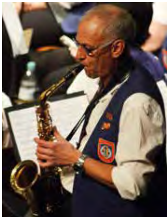
Musikverein 06 Urberach

und Vereinen aus den Gastländern werden wir uns im Park am Entenweiher auf eine musikalische Rundreise begeben.