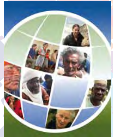
Ausstellung „Wir sind alle Zeugen“

17.00 Uhr BANDART Tanztheater kombiniert mit den neuesten interaktiven Technologien, um visuell beeindruckende Performances zu schaffen.